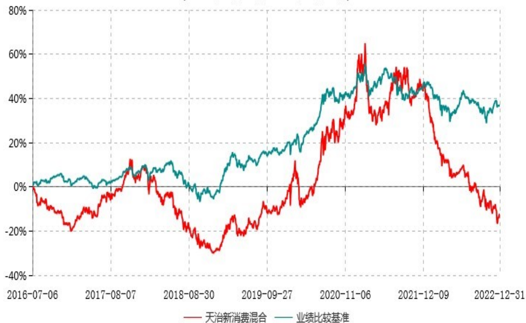
天治新消费灵活配置混合型证券投资基金累计净值增长率与业绩比较基准收益率历史走势对比图 (2016年07月06日-2022年12月31日)