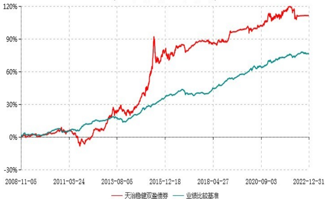
天治稳健双盈债券型证券投资基金累计净值增长率与业绩比较基准收益率历史走势对比图 (2008年11月05日-2022年12月31日)