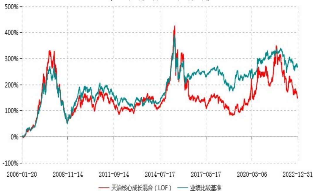
天治核心成长混合型证券投资基金（LOF）累计净值增长率与业绩比较基准收益率历史走势对比图 (2006年01月20日-2022年12月31日)